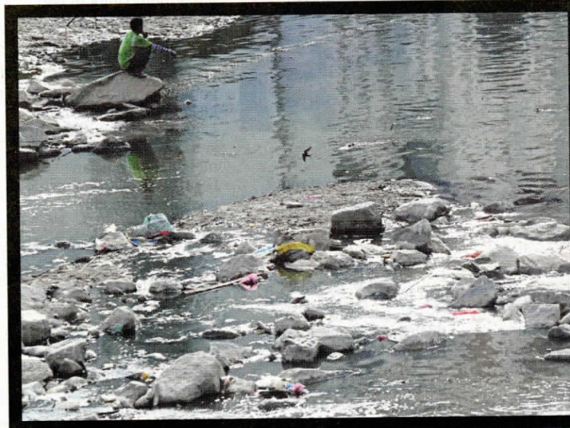
LONGGOKAN sampah dibuang penduduk dalam sungai.

Menurutnya, timbunan sampah di permukaan air menyebabkan banjir kilat di Lembah Klang sekali gus