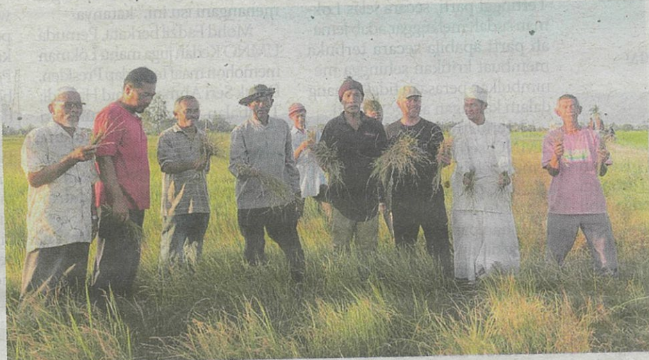
Petani menunjukkan hasil padi yang tidak menjadi kerana tidak mendapat bekalan air.

rusan, kami bimbang tiada apa untuk dituai bagi musim ini," katanya ketika ditemui kelmarin.