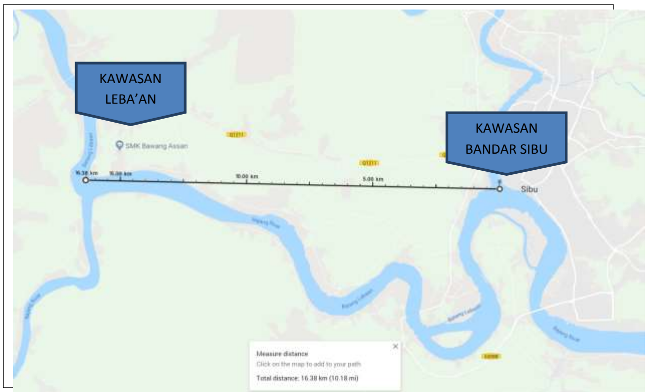
PETA LOKASI BANDAR SIBU DAN KAMPUNG LEBA'AN